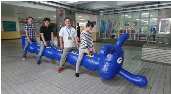
每隊 12 人，4 人一組為一個棒次(共 3 棒)