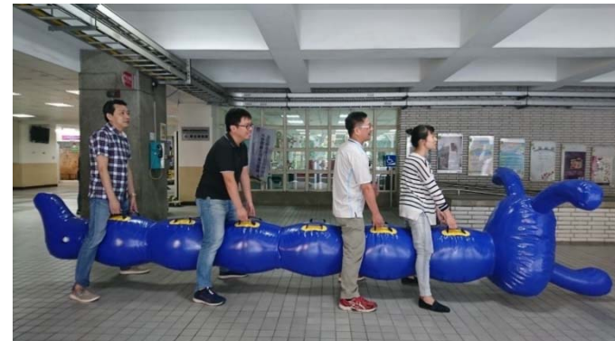
競賽全程禁止下毛毛蟲(毛毛蟲本體禁止乘坐)