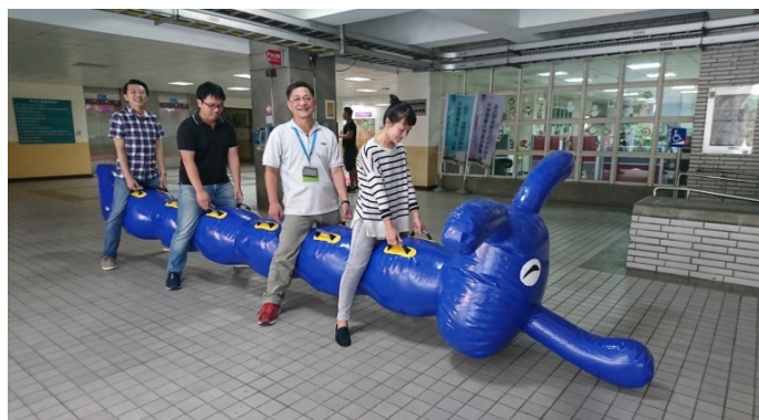
每隊 12 人，4 人一組為一個棒次(共 3 棒)