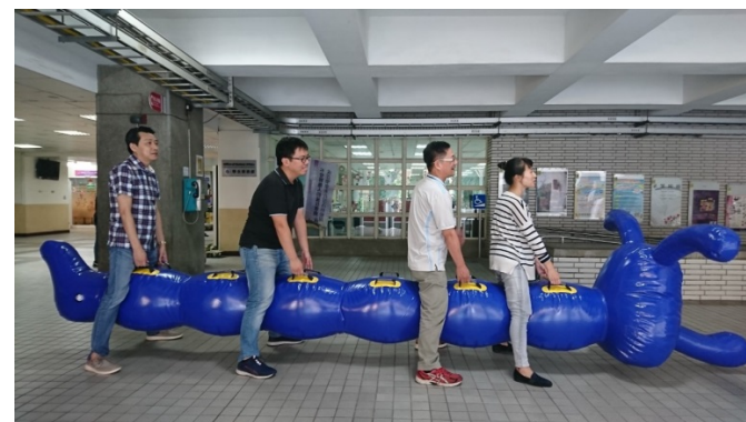
競賽全程禁止下毛毛蟲(毛毛蟲本體禁止乘坐)